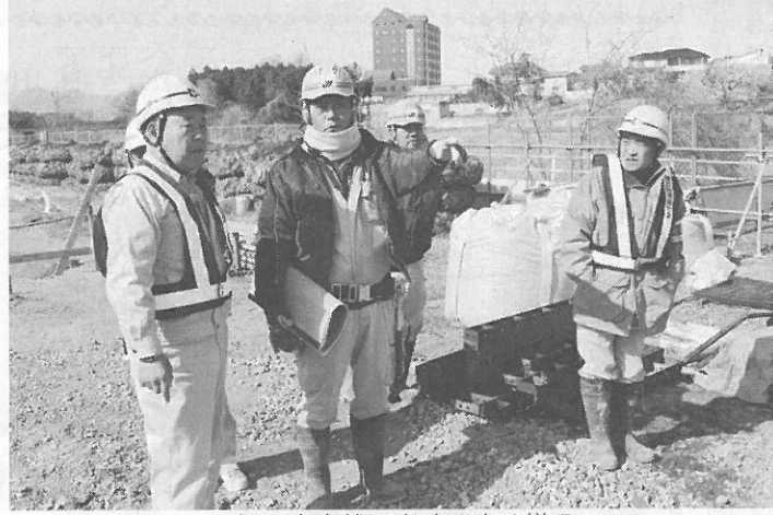
現場の安全状況を確認する様子

内の中学校や和田橋運動広場、都市計画道路などでパトロールを行った。安全管理体制の確認をより高めていき、労災事故ゼロを官民一体となって目指していく。